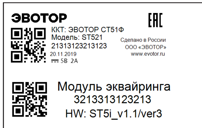
Рисунок 3. Пример маркировочного шильда