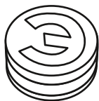
Рисунок 1. Изображение пломбы