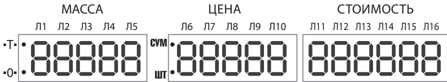
Рис. 2. Индикаторы